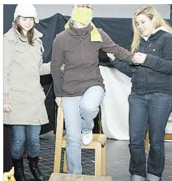
Bei der Adventsaktion in der Jugendkirche musste ein Parcours mit Hindernissen überwunden werden – mit verbundenen Augen und der Hilfe eines Klassenkameraden.

ken. Engel wurden in verschiedensten Darstellungen gezeigt, von kitschig bis klassisch. Gar nicht so einfach war beispielsweise ein Parcours mit Hindernissen, den die Jugendlichen mit verbundenen Augen überwinden mussten. Einzige Hilfe waren jeweils Klas-