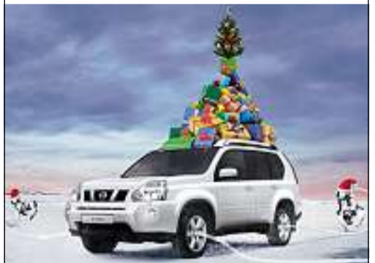
Abb. zeigt Sonderausstattung. Zum Jahresende möchten wir uns ganz herzlich bei Ihnen für Ihre Treue bedanken. Wir wünschen Ihnen ein frohes Weihnachtsfest und einen guten Rutsch ins neue Jahr! Ihr Team vom WB AutoCenter!

WIR WÜNSCHEN: MERRY X-TRAIL AND A HAPPY NEW YEAR.